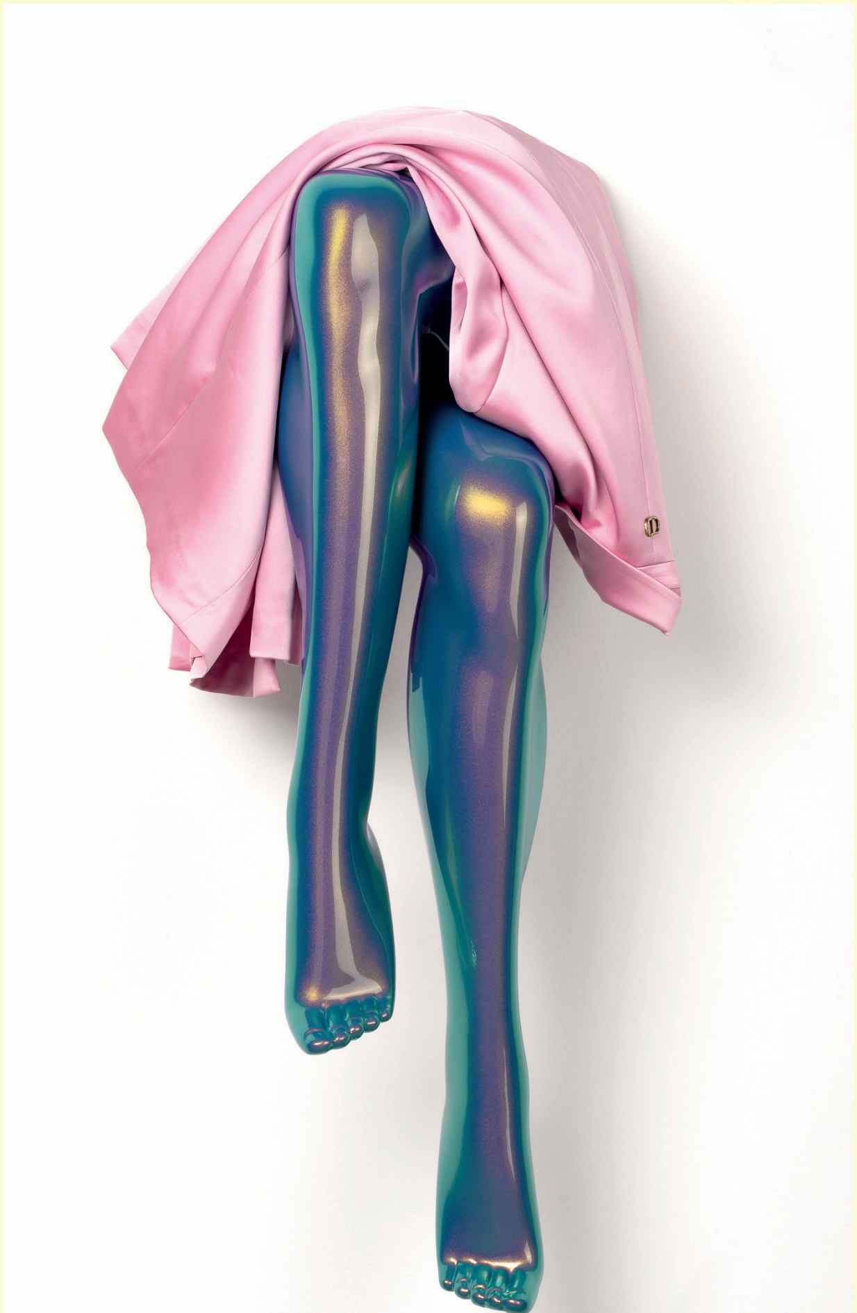
Sylvie Fleury, Titane , 2024.