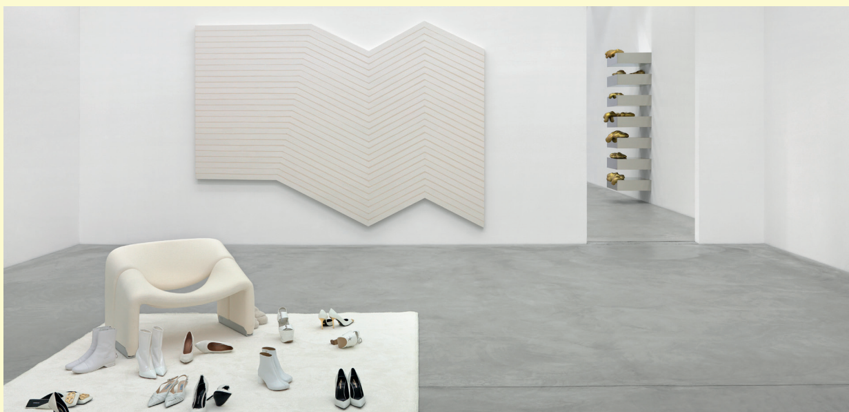
Sylvie Fleury, Vue d'installation, Shoplifters from Venus , Kunstmuseum Winterthur, 2023.

Sylvie Fleury est née en 1961 à Genève, où elle vit et travaille. Depuis 1991, elle a présenté de nombreuses expositions individuelles et collectives à travers l'Europe et les États-Unis. Parmi les dernières monographies, on peut citer : Kunsthall Rotterdam (2024); Kunst Museum Winterthur (2023); Pinacoteca Agnelli, Turin (2022); Kunstraum Dornbirn, Autriche (2019).